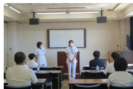
先輩からの生の声